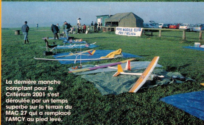
La dernière manche comptant pour le Critérium 2001 s'est déroulée par un temps superbe sur le terrain du MAC 27 qui a remplacé l'AMCY au pied levé.

A Blainville Crevon, c'est l'heure de la proclamation des résultats et de la remise des prix, autour d'un verre bien entendu !