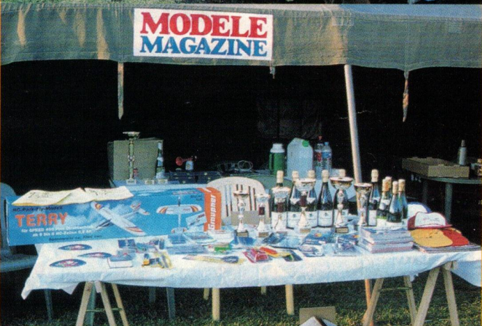
Le Critérium fut généreusement doté par quelques sponsors qui ont décidé d'encourager cette initiative du FF-2000, dont Modèle Mag bien sûr.