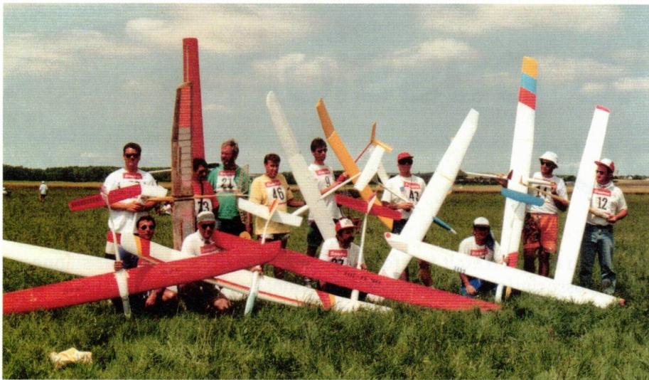
Premier tournoi international de F3J à Gisy les Nobles en 1993, avec ici les 12 finalistes.