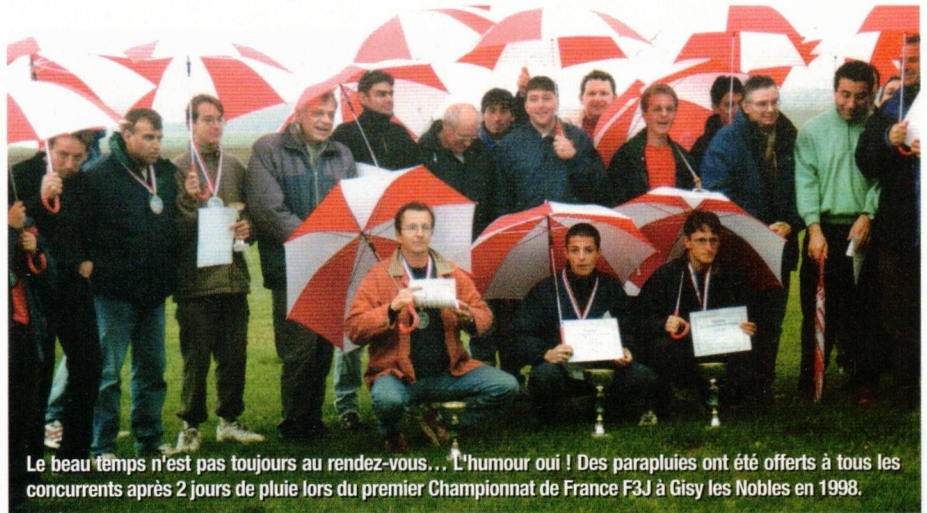
Le beau temps n'est pas toujours au rendez-vous... L'humour oui ! Des parapluies ont été offerts à tous les concurrents après 2 jours de pluie lors du premier Championnat de France F3J à Gisy les Nobles en 1998.

En l'an 2000, Eole améliore le règlement de la Formule France pour lui donner plus d'attrait en créant la F.F.2000, ainsi qu'un Critérium avec la collaboration des clubs, puis organise la 1ère Rencontre Nationale en 2002. Il aide des clubs à organiser des Coupes Nationales, 7 au total, jusqu'à la reconnaissance, due au succès, d'un Championnat de France en 2009.