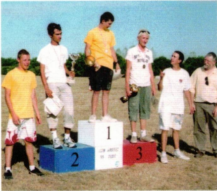
L'association Eole, c'est un nombre de podiums incalculable au fil de 44 années d'organisations... Ici, le podium junior de la FF2000 en 2009 à Teillé.