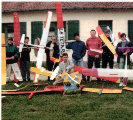
Le stage à la Montagne Noire a été un événement annuel important pour Eole. Ici le groupe de juillet 1997.

Eole a aussi participé à l'expansion de la Formule France, formule de durée, première marche vers la compétition, en organisant des concours et en aidant d'autres clubs dans le déroulement des concours. Eole organise à partir de 1988 un rassemblement d'une semaine à la Montagne Noire pour ses membres et cela pendant 10 ans. Mais tout a hélas une fin et celle-ci fut liée aux conditions d'hébergement. Beaucoup de souvenirs sont restés pour certains.