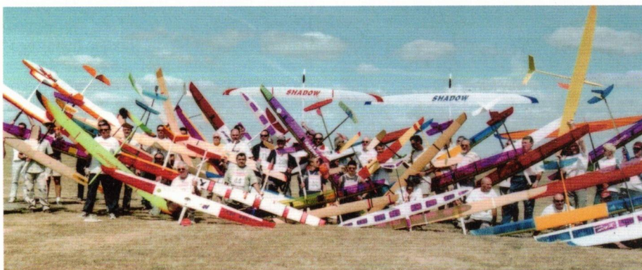
Premier championnat de France de Formule France 2000 à Teillé en 2009, avec 46 concurrents.

Souhaitons juste d'être encore là dans nombreuses années !