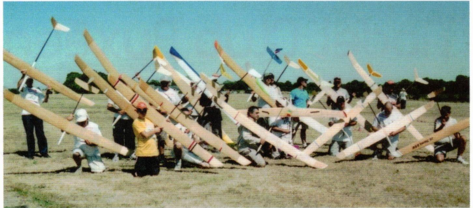
En FF2000, les planeurs légers et performants Art Hobby sont appréciés et leurs pilotes se regroupent.