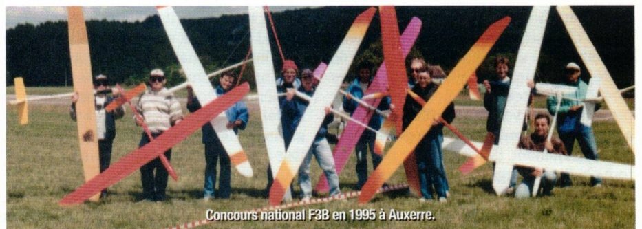
Concours national F3B en 1995 à Auxerre.